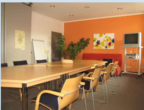
Gruppenraum der Institutsambulanz