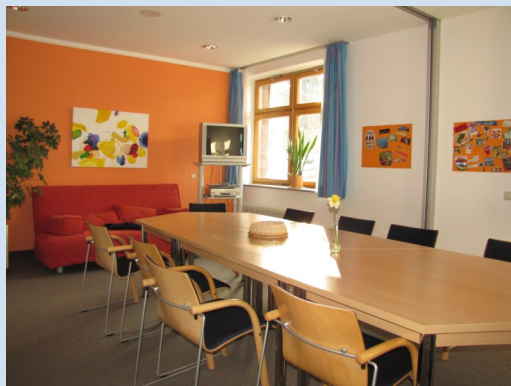
Gruppenraum der Institutsambulanz

Die allgemeine Psychiatrische Institutsambulanz (PIA) versteht sich als Brücke zwischen ambulanter haus- und fachärztlicher Versorgung sowie den komplementären Trägern der Eingliederungshilfe und des gemeindenahen sozialpsychiatrischen Verbundes einerseits und der stationär psychiatrischen Krankenhausbehandlung andererseits. Sie arbeitet nach dem Modell der beziehungsorientierten Psychiatrie und Psychotherapie und nutzt dabei im Rahmen ihrer multiprofessionellen Angebote unterschiedliche Therapieverfahren.