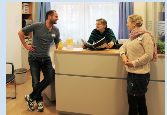
Team der Institutsambulanz

Zusätzlich verfügen verschiedene Teammitglieder über Zusatzqualifikationen, z.B. für systemische-, verhaltens- und traumatherapeutische Verfahren sowie Suchtmedizin. Darüber hinaus steht die gesamte Kompetenz der Klinik für Psychiatrie, Psychotherapie und Psychosomatik der Ev. Lukas-Stiftung Altenburg den Klienten der PIA und ihren Angehörigen zur Verfügung.